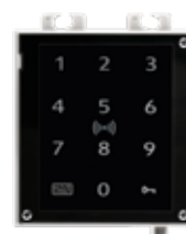
2N® ACCESS UNIT 2.0 TOUCH KEYPAD & RFID 9160336 9160336-S (Sicherung)