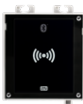
2N® ACCESS UNIT 2.0 BLUETOOTH & RFID 9160335 9160335-S (Sicherung)