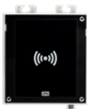
2N® ACCESS UNIT 2.0 RFID 9160334 9160334-S (Sicherung)